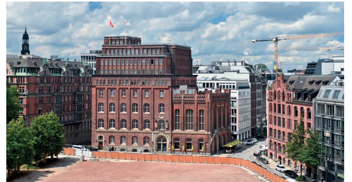
Das Haus der Patriotischen Gesellschaft an der Trostbrücke, wirtschaftliche Basis der Patriotischen Gesellschaft und Zentrum ihrer gemeinnützigen Arbeit