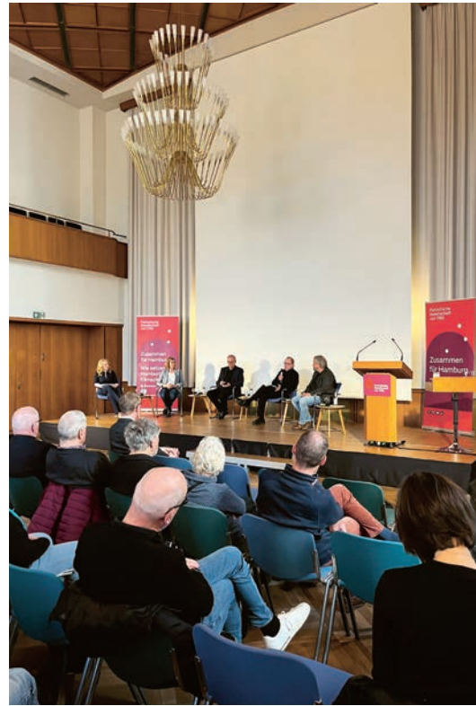
Diskussionsveranstaltung zum Hamburger Klimaentscheid am 20. April 2026 im Reimarus-Saal

Die Beiträge vom Podium und aus dem Auditorium haben erneut verdeutlicht, dass die Herausforderungen bei der Umsetzung der Klimaziele nur von der Stadtgesellschaft gemeinsam bewältigt werden können. Die Politik muss die Bürgerinnen und Bürger dabei mit ins Team holen. Ein losbasierter Bürgerrat, der in seiner Zusammensetzung die Stadtgesellschaft abbildet, kann die Politik bei ihrer schwierigen Aufgabe unterstützen, die Stadt durch die Zumutungen des Klimawandels zu steuern.