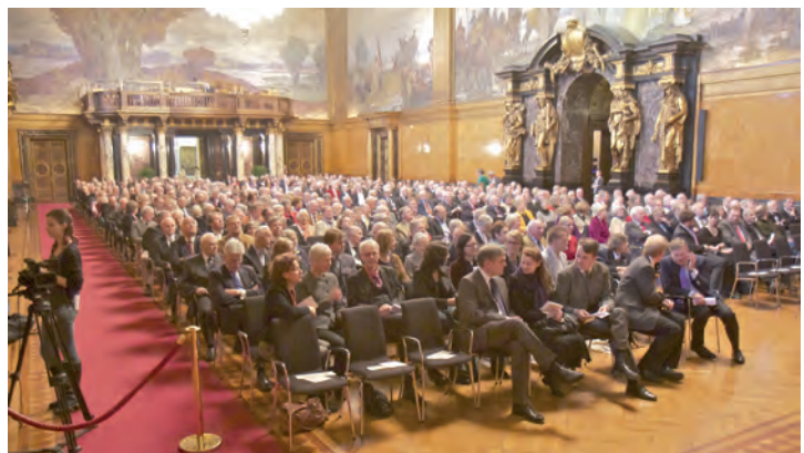
Senatsempfang anlässlich des 175-jährigen Bestehens des Vereins für Hamburgische Geschichte am 9. April 2014

Die enge Zusammenarbeit beider Institutionen hält seit Gründung des Vereins für Hamburgische Geschichte an. Über einen langen Zeitraum hinweg gab es sogar eine räumliche Verbindung: Von 1839 an war der VHG im Gebäude der Patriotischen Gesellschaft beheimatet, zunächst im Haus in der Großen Johannisstraße, dann, nachdem dieses dem Hamburger Brand von 1842 zum Opfer gefallen war, ab 1847 im neuen Gebäude an der Trostbrücke. Und auch nach dessen weitgehender Zerstörung im Zweiten Weltkrieg blieb der VHG – dessen Hab und Gut inklusive kostbarer Bild- und Handschriftensammlungen, Bibliothek und eigenem Archiv durch die Bombenangriffe vom Sommer 1943 nahezu vollständig verbrannt war – unter dem Dach der Patriotischen Gesellschaft und richtete sich an der Trostbrücke wieder ein, sobald dies nur möglich war. Erst 1972 zog die inzwischen neu aufgebaute VHG-Bibliothek wegen des erhöhten Eigenbedarfs der Patriotischen Gesellschaft aus deren Gebäude ins Staatsarchiv um, wo sie auch heute wie die Geschäftsstelle des Vereins ihren Sitz hat. Noch immer aber verfügt der VHG satzungsgemäß über Sitz und Stimme im Beirat der Patriotischen Gesellschaft und nach wie vor erhält er dankenswerterweise eine jährliche Zuwendung, die heute zur Finanzierung der renommierten und weit verbreiteten Zeitschrift des Vereins für Hamburgische Geschichte (ZHG)