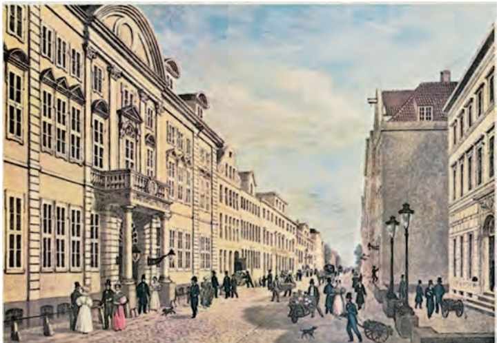
Stadthaus am Neuen Wall um 1830

Der Hilfe zur Selbsthilfe war ein schneller Erfolg beschieden. So verlief der Start der Haspa am 16. Juni 1827 mit „glücklichem Erfolge“ und brachte überraschend lange Schlangen vor den ersten beiden „Annahme-Bureaus“: Nicht nur Dienstboten und andere typische Geringverdiener wollten ihr Geld anlegen, sondern auch wohlhabendere Bürger, Geschäftsleute, Handwerker und andere Gewerbetreibende brachten ihr Geld zur Haspa. Das ursprüngliche Konzept einer „Armen-Sparkasse“ wurde von den Bürgern abgewandelt. So ist bereits der Gründungstag wegweisend für die Haspa gewesen, die ihre Dienstleistungen heute jedem Hamburger unabhängig vom sozialen Status anbietet.