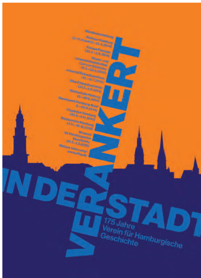
Plakat der Jubiläumsausstellung „In der Stadt verankert“, die von April 2014 bis März 2015 an zehn Orten in Hamburg zu sehen war