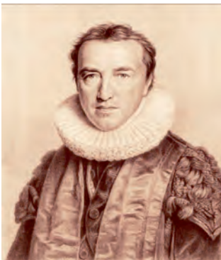
Auf Initiative von Amandus Augustus Abendroth und weiterer Hamburger Bürger wurde 1827 die Hamburger Sparkasse gegründet

Ziel der Sparkassengründung war es erneut, die finanziell schwächeren und notleidenden Bevölkerungsschichten zu unterstützen. Mit Gründung der Haspa sollten die Hamburger endlich dauerhaft die Möglichkeit erhalten, sich durch Sparen gegen wirtschaftliche Not zu wappnen.