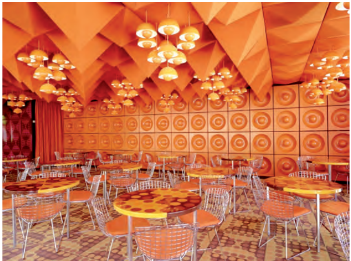
Verner Pantan, SPIEGEL-Kantine, orange- und gelbfarbener Speiseraum, 1969 – heute im MKG

Die Rolle der Museen hat sich grundlegend verändert. Hervorgegangen aus den Kunst- und Wunderkammern des 16. Jahrhunderts versammeln sie zunächst kostbare Luxusgüter, die von