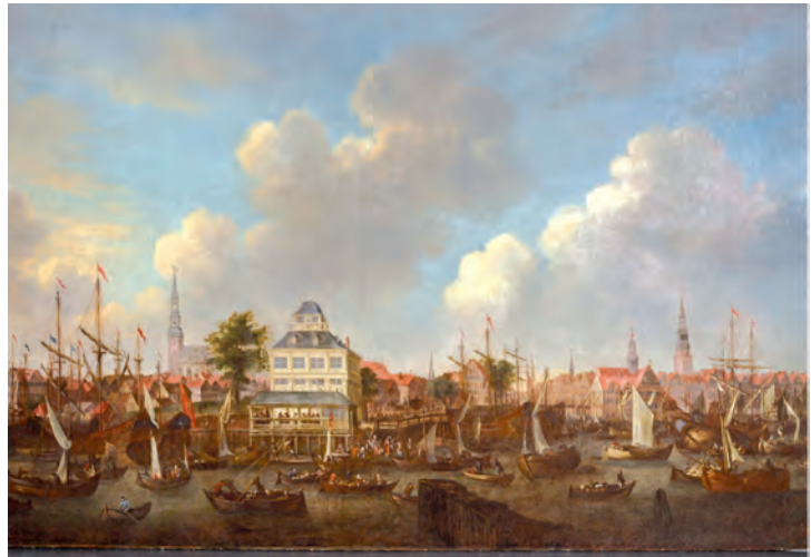
J. G. Stuhr: Baumhaus um 1690, Zustand nach Restaurierung – im Eigentum der Patriotischen Gesellschaft, anlässlich ihres 250. Jubiläum vom Hamburg Museum restauriert.

Über die Jahre wuchsen die Sammlungsbestände kontinuierlich. Die Verluste in Folge des Zweiten Weltkrieges blieben, bedingt durch umfassende Auslagerungen, vergleichsweise gering. Bis heute werden die Sammlungen, vornehmlich durch Schenkungen, weiter ergänzt und erweitert. Den umfangreichsten Bestand stellt die mehrere hunderttausend Blatt umfassende Einzelblattsammlung dar; sie besteht aus Zeichnungen, Druckgrafik, Postkarten, Aquarellen sowie Gebrauchsgrafik (Plakate, Werbemarken, Eintrittskarten, Prospekte), reicht zeitlich vom 16. Jahrhundert bis zur Gegenwart und geht in diesem Sammlungsspektrum weit über eine klassische Grafiksammlung hinaus. Ein Hauptschwerpunkt