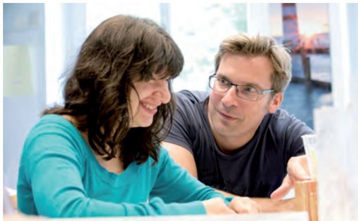
Ein SeitenWechsler im direkten Kontakt während seiner Woche in einer Behinderteneinrichtung.

Diese Menschen gehören zu unserer Gesellschaft und ihr Leben ist Teil unserer Welt. Durch einen SeitenWechsel erhalten Führungskräfte die Möglichkeit, diese Lebenszusammenhänge kennen zu lernen, sich ihnen bewusst zu nähern und zu lernen, mit ihnen umzugehen