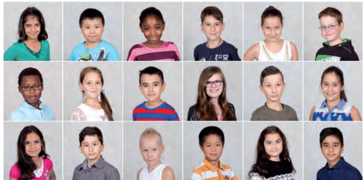
Die 18 Stipendiaten-Kinder im Diesterweg-Stipendium Hamburg 2014-2016 (2. Durchgang)

Brücken und überwindet Hemmschwellen und Bildungsbarrieren. Dies wird möglich durch die Bündelung gesellschaftlicher Kräfte, staatlicher und privater Initiative, institutionellem und individuellem Engagements. Das Diesterweg-Stipendium nutzt Vorhandenes: Strukturen, Angebote und ehrenamtliche Hilfsbereitschaft, die es in der Bürgergesellschaft Hamburgs schon gibt. Das Familienstipendium schafft Zugänge. Die Kultur- und Bildungslandschaft Hamburgs wird erschlossen für Familien aus abgehängten sozialen Quartieren und ihre begabten Kinder aus Schulen in schwieriger sozialer Lage. Damit zeigt das Stipendium