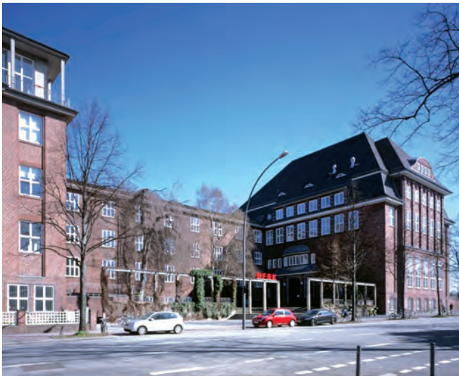
Hauptgebäude der Hochschule für Bildende Künste