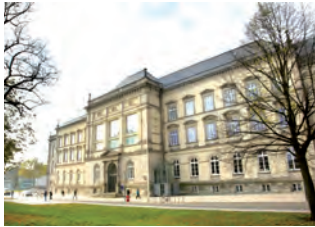
Das Gebäude des Museums für Kunst und Gewerbe Hamburg am Steintor

Immer wieder wird die Patriotische Gesellschaft, unterstützt von Hamburger Bürgern, beim Senat vorstellig. 1865 erteilt die Stadt ihre Zustimmung: In den Räumen der Patriotischen Gesellschaft eröffnen eine Gewerbeschule und eine Schule für Bauhandwerker. Eine Vorbildersammlung ist nicht vorgesehen. Dabei boten längst das 1852 gegründete South-Kensington-Museum in London (heute: Victoria & Albert Museum) und das 1864 eröffnete Oesterreichische Museum für Kunst und Industrie (heute: Museum für Angewandte Kunst) in Wien dem ortsansässigen Gewerbe wertvolle Impulse und führten zu einem Aufschwung des regionalen Kunsthandwerks. In Paris habe das Kunstgewerbemuseum einen sehr guten Einfluss auf das örtliche Gewerbe, so berichten zwei Gewerbelehrer, die die Patriotische Gesellschaft 1867 zur Weltausstellung nach Frankreich schickt. Am 28. Mai 1866 ruft auch der 23-jährige Justus Brinckmann in den „Hamburger Nachrichten“ zur Gründung eines „Hamburgischen Museums für Kunst und Industrie“ auf. Vor dem Hintergrund des Stilpluralismus der vergangenen Jahrzehnte sei besonders das Kunstgewerbe dem „Modewechsel speculierender Engros-Fabrikanten“ ausgeliefert. Eine Vorbildersammlung biete nicht nur Orientierung und Inspiration für das Gewerbe, sondern könne auch veredelnd auf die Geschmacksbildung der Bevölkerung einwirken.