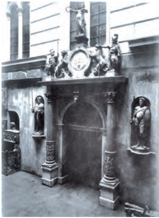
Das alte Rathausportal im westlichen Lichthof des alten Johanneums um 1900