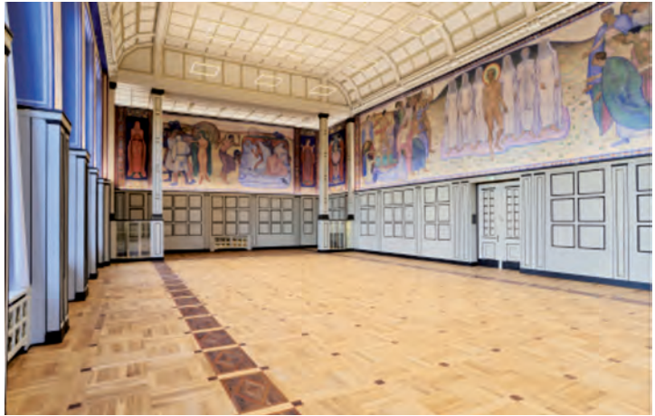
Renovierte Aula in der HFBK, 2013

Museum für Kunst und Gewerbe teilte. 1896 avanciert die nun 24 Fachklassen umfassende Einrichtung zur Staatlichen Kunstgewerbeschule. Nicht einmal zwei Jahrzehnte später bezog diese 1913 ihr eigenes, von Fritz Schumacher entworfenes Gebäude am Lerchenfeld, das heutige Hauptgebäude der HFBK Hamburg.