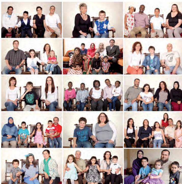
Die 15 Stipendiaten-Familien im Diesterweg-Stipendium Hamburg 2012-2014 (1. Durchgang)

Die unabhängige Begleitstudie wertete Interviewergebnisse aus: Den beteiligten Lehrern gefällt besonders gut, dass Stipendiaten-kinder, Eltern und Geschwister gemeinsam von dem Programm profitieren. Damit erhält die ganze Familien Impulse, lernt Neues kennen und macht zugleich stärkende Beziehungserfahrungen. Die Familien schätzen am Programm besonders die Unterstützung und Ermutigung. Sie sagen, die eigene Familie und die Gemeinschaft mit den anderen Familien stärkt, ebenso wie die Beratung in Schul- und Erziehungsfragen und die Unterstützung bei der Alltagsbewältigung. Die Familien und ihre Kinder fühlen sich in ihrer Lebenssituation beachtet und anerkannt. Die Bildungsangebote Hamburgs werden aktiver genutzt. Kinder und Familien nehmen ihre neuen Chancen wahr.