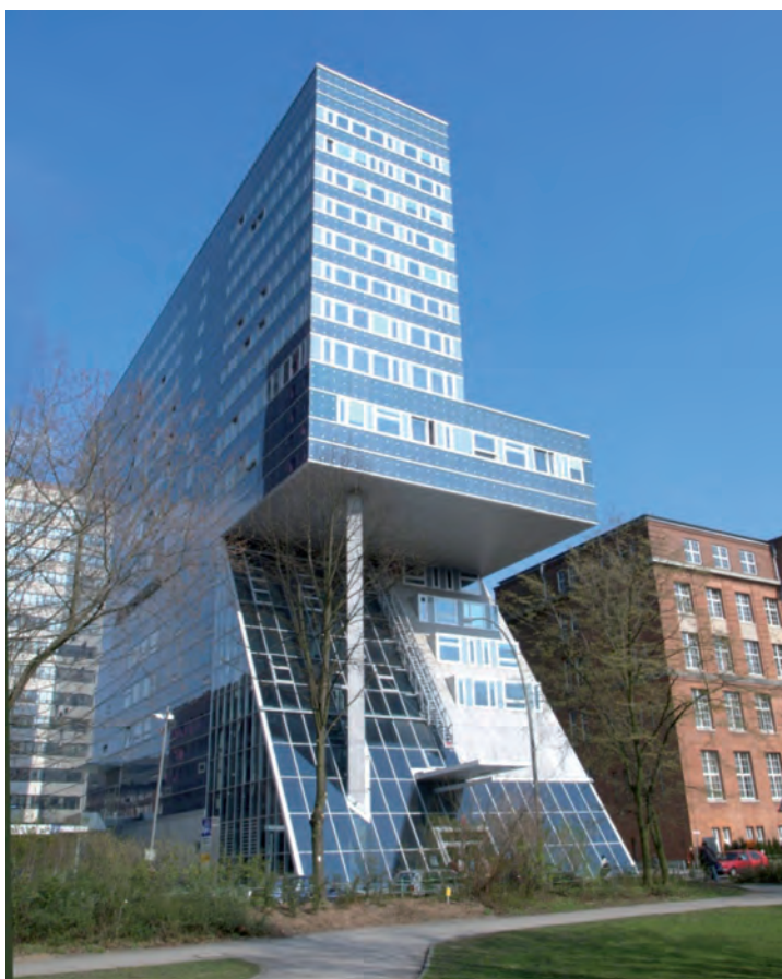
Das Hauptgebäude der HAW Hamburg

Die Details dieser Entwicklung, so spannend sie in ihrem gesellschaftlich-historischen Kontext auch sein mögen, sind hier nicht im Einzelnen darstellbar. Was für uns heute noch von Bedeutung ist und das Jubiläum lebendig macht, sind Geist und Haltung, die diese Entwicklung ermöglicht und angetrieben haben. Kennzeichnend ist zum einen das aus dem erkenntnisorientierten Geist der Aufklärung entspringende bürgerschaftliche Engagement, das in Hamburg als erster deutscher Stadt zur Gründung einer privaten „Schule von Künstlern und Handwerkern“ führte (mit Künstlern waren seinerzeit noch Fachleute gemeint, die Künstler in ihrem Fach waren). Hinzu kam die ästhetische Bildung, die ihren Ausdruck neben der 1768 gegründeten